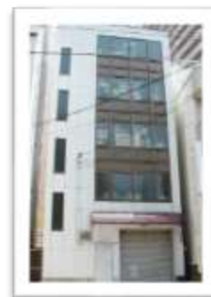
堂ヶ芝 製造・部品 センター